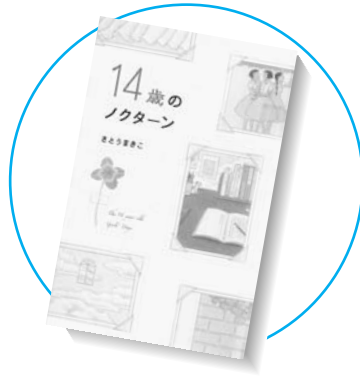
14歳のノクターン 作／さとうまきこ 絵／早川司寿乃 ポプラ社

石田三成は、豊臣家の忠義の家臣として知られていますが、この本では、彼の政治家としての、太閤検地や兵農分離を断行した手腕に着目して、新しい「三成」像を私たちに提示します。