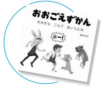
おおごえずかん —おおきなこえであいうえお— 作・絵／新井洋行 コクヨS&T株式会社

小説家の章子が、ふと見つけたのは、中学二年の時の文集と、なつかしい親友の写真。次々と思い出す、友だちと過ごした日々、苦い初恋・・・。14歳の少女だった私の物語。