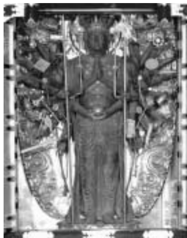
※この本尊は秘仏ですが、写真は千手院へ承諾のもと撮影・掲載しています。

平成24年11月、「川道観音」と呼ばれる千手院の本尊千手観音像が、実に16年ぶりに開帳されました。33年目ごとに本開帳される秘仏ですが、その半期にあたる中開帳として公開されました。 丸い顔立ちに太い眉と強い眼差し。深く整然と彫り揃えられた翻波式くせり出した腹。腰高な脚部に、浅く整然と彫り揃えられた翻波式衣文。極めて洗練された像容は平安時代前期の特色を備え、失われやすい脇手には一部当初の御手が残ります。 なぜ秘仏はこうも私たちを惹きつけてやまないのでしょうか。ムラの人たち総出で大法要が執り行われ、全高26mの飾り物(幡母衣)に使うスギ材は関ヶ原から徒歩で運ばれてきたといわれています。お練り行道供養の稚児行列には120人もの子どもたちが集まり、日ごろ閑静な集落には参拝者が押し寄せました。川道観音の求心力の大きさと、そのような秘仏を護り続けていく「重み」を垣間見た御開帳でした。 また16年後にお目に掛かりましょう。 ※大きい波と小さい波を交互に繰り返すような衣の襞のこと。