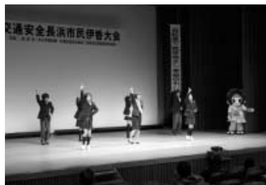
田名部生来さん (AKB48) と伊香高校SOUND会 (交通安全長浜市民伊香大会にて)

日本道路交通情報センター (全国共通) (☎050-3369-6666) ホームページ http://www.jartic.or.jp/ 日本道路交通情報センター (滋賀情報) (☎050-3369-6625)