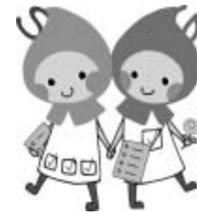
滋賀県の健康づくり健(検)診啓発 マスコットキャラクター 「しかのハグ&クミ」

この機会にあなたのため、大切な家族のために、がんと向き合う第一歩を検診で踏み出しませんか。