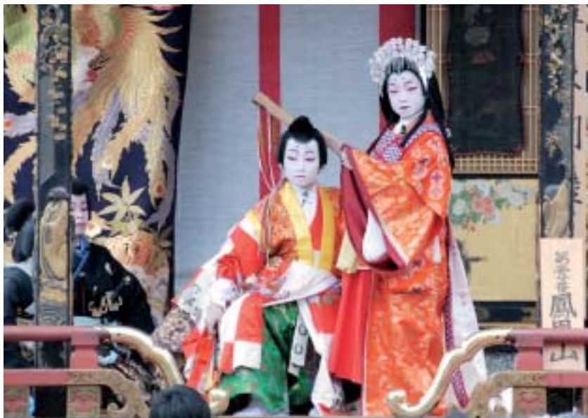
▶ 昨年の曳山まつりから

秀吉公の男子誕生を祝ってはじまったとされる長浜曳山まつり。絢爛豪華な曳山に、あどけなさが残る子ども役者の歌舞伎上演など、400年もの間、町衆によって脈々と受け継がれてきました。今年には新長浜市誕生を記念して、お旅所に長刀山をはじめ、曳山が全山出場します。(月宮殿は修理中のため曳山博物館ドック前で展示されます) 新たな歴史の幕開けに、4月15日夜を頂点として、今年の祭りは大いに盛り上がります。