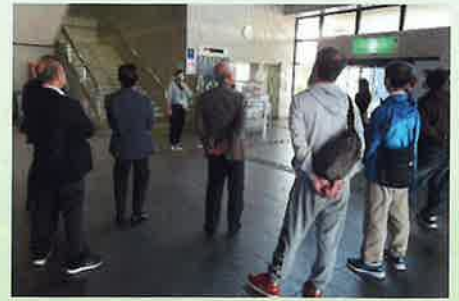
【玄関ホールにて概略説明】

1948(昭和23)年6月、福井市は、市全体が壊滅状態となるマグニチュード7.1(震度6)の直下型大地震が起こり、さらに同7月には豪雨水害が追い打ちをかけました。また1945(昭和20)年の空襲では、市街地全域が焼失し戦災復興途上のなか重なる甚大な被害をこうむってきました。