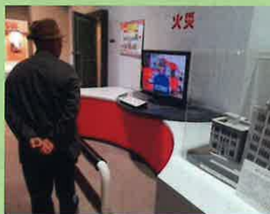
【写真⑥ 火災:展示コーナー】