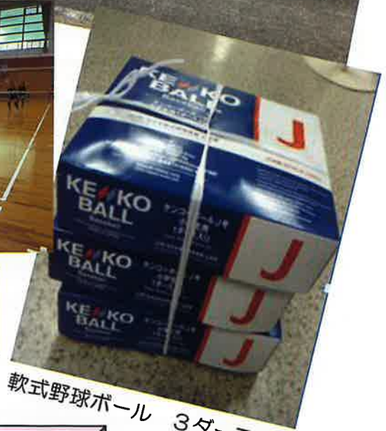
軟式野球ボール 3ダース