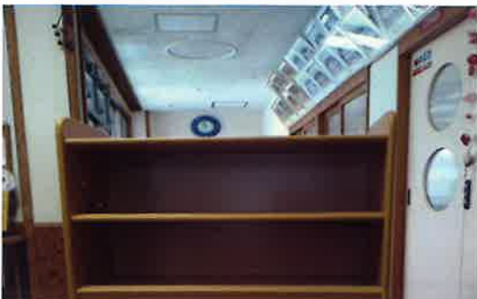
整理棚 (小谷こども園)