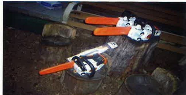
チェーンソー 3台 (小谷城址保勝会)