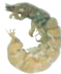
オオシマトビケラ

頭から胸にかけて固く、うすい茶色である。他は茶色から緑色でやわらかく、頭の上部の平たい部分が広いのが特徴。 さなぎは石粒などを使って固めた巣で過ごす。 ●ましがえやすい生物 シマトビケラとましがえやすい