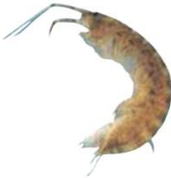
ニホンドロソコエビ