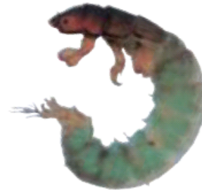
コガタシマトビケラ

頭の先に小さなくぼみがあるのが特徴で、頭と胸は赤茶色をしている。腹は鮮やかなうす緑色から緑がかった茶色、あるいは茶色などいろいろな色をしている。