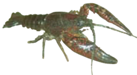
アメリカザリガニ

北海道や東北地方などには、きれいな水にすむもともと日本にいた別種類のザリガニがいる。