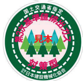
第3次基準値 表示（ラベル）