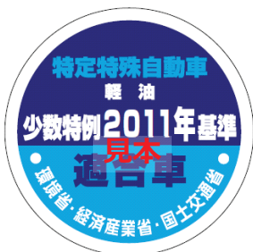
オフロード法 2011年基準適合表示（ラベル）、少数特例表示（ラベル）