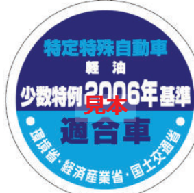
オフロード法 2006年基準適合表示（ラベル）、少数特例表示（ラベル）