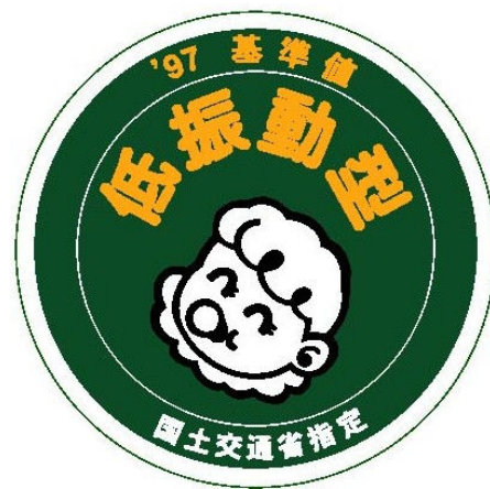
様式第6号（第十条関係）