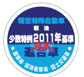
オフロード法 2011年基準適合表示（ラベル）、少数特例表示（ラベル）