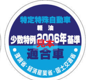
オフロード法 2006年基準適合表示（ラベル）、少数特例表示（ラベル）