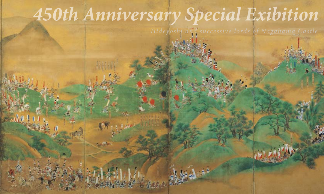
秀吉 vs 勝家 雌雄を決した戦い 賤ヶ岳合戦図屏風(右隻) 大阪城天守閣蔵【後期展示】