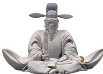
豊臣秀吉坐像 長浜市指定文化財 知善院蔵【第2会場】