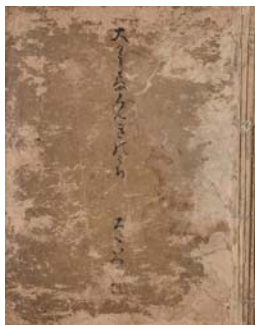
大かうさまくんきのうち 太田牛一筆 重要文化財 慶應義塾図書館蔵【後期展示】