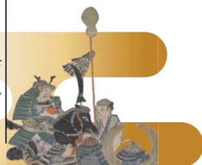
長篠合戦図屏風(部分) 長浜城歴史博物館蔵