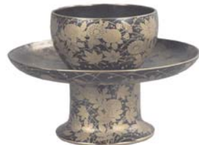
秋草蒔絵天目台 重要文化財 高台寺蔵【前期展示】

長浜城は、北近江を支配した浅井長政(1545-73)と織田信長(1534-82)の戦いで功績を挙げ、はじめて城持の大名となった羽柴秀吉(のちの豊臣秀吉、1537-98)が琵琶湖畔に築いた城です。