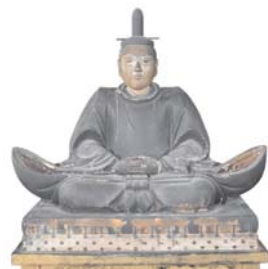
於次秀勝像 京都瑞林院蔵【第2会場】