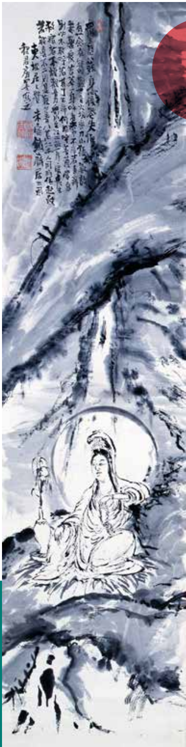
普陀落山観世普菩薩像