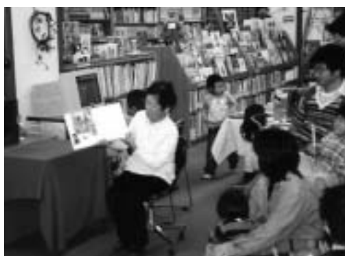
図書館でのおたのしみ会

にじの会は、昭和58年の長浜市立図書館の開館時から活動されている団体です。主な活動は図書館や公民館での読み語りや、幼稚園や小学校と連携した読み聞かせです。さらには、読書活動の良さを広めるために講演会を開催するなど精力的に活動されています。