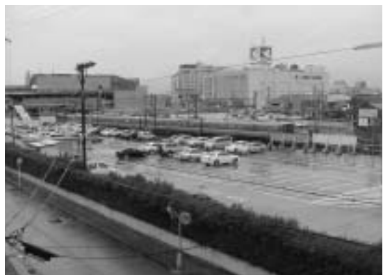
市営長浜駅西駐車場

平成18年は、事業所・企業統計調査、工業統計調査、社会生活基本調査、労働力調査、毎月勤労統計調査などがあります。