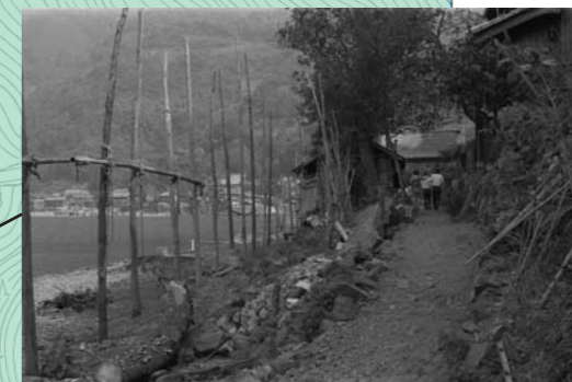
東のイナバ。浜には稲を干すハサが並んでいました。そこをイナバと呼んでいました。菅浦の水田は集落から離れた所にあります。収穫した稲を田舟で浜まで運びハサで乾燥させました。