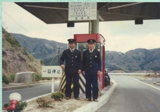
奥琵琶湖パークウェイ。昭和46年に菅浦の山中に開通しました。料金所や食堂は菅浦の新たな雇用の場になりました。