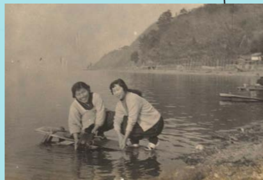
ウマ。棧橋より小さく洗い場に利用された板をウマと呼びました。ウマは何軒かが共同で使いました。