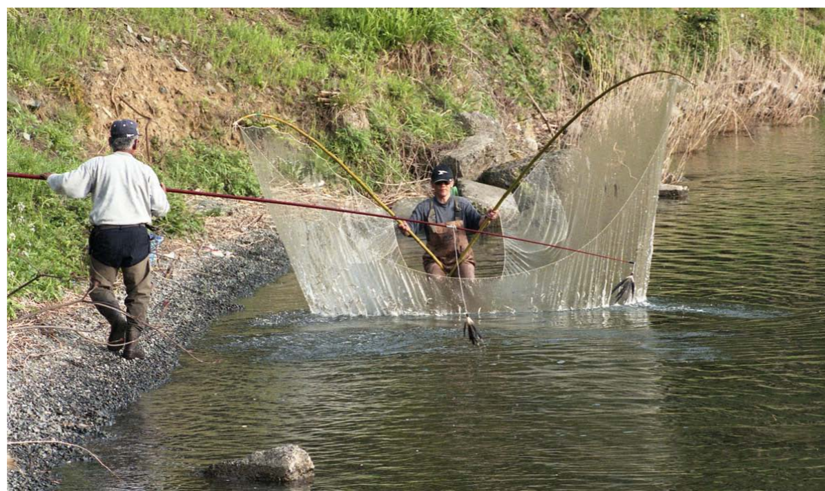
オイサデ漁。追い棒と呼ばれるカラスの羽をつけた長い竹竿でアユを網に追い込んで獲ります。水温が低くアユの動きが鈍い 4、5 月が漁期で、多い時は 1 日で 200kg の漁獲量があります。

編集・発行：長浜市教育委員会 文化財保護センター 〒526-0802 滋賀県長浜市東上坂 981 番地 TEL 0749-64-0395 FAX 0749-62-6357 Email bunkazai@city.nagahama.lg.jp 発行月 平成 24 年 8 月