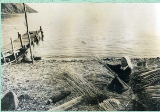
ヨシの調整。ヨシは屋根材として大量に必要なため、他の地域から購入していました。写真の女性は浜でヨシの長さを揃えています。