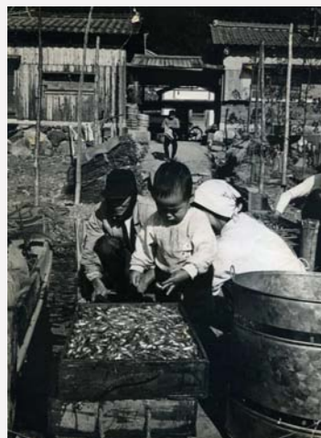
水揚げされたイサザを興味深げに見る子ども。

浜は様々な物が集まる場所でした。水揚げされる魚、山から伐りだされた柴や薪、ハサで乾燥される稲、台風後の流木など。また網を干したり、ヨシを切りそろえるなどといった仕事の作業場所としても浜は利用されました。さらに洗濯や水汲み、子どもの遊び場も浜でした。かつて菅浦の生業・生活は浜を中心に動いていたのです。