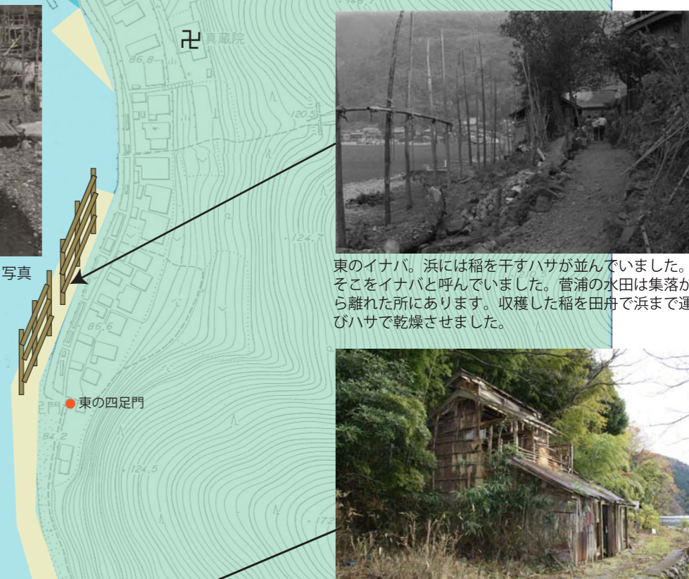
タバコ小屋。菅浦では、昭和35年頃までタバコを生産していました。現在でも乾燥場跡が残っています。