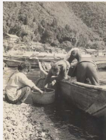
浜で魚をもらう女性。夕飯のおかずにするのでしょうか。