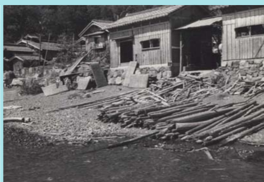
流木。台風の後などに打上げられた流木は、住民が入札をして、ハサなどに使いました。