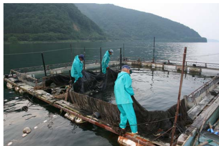
エリ漁。現在一つのエリ組が大浦湾で二つのエリを操業しています。11 月から 7 月上旬までアユや小エビ、イサザなどを獲ります。