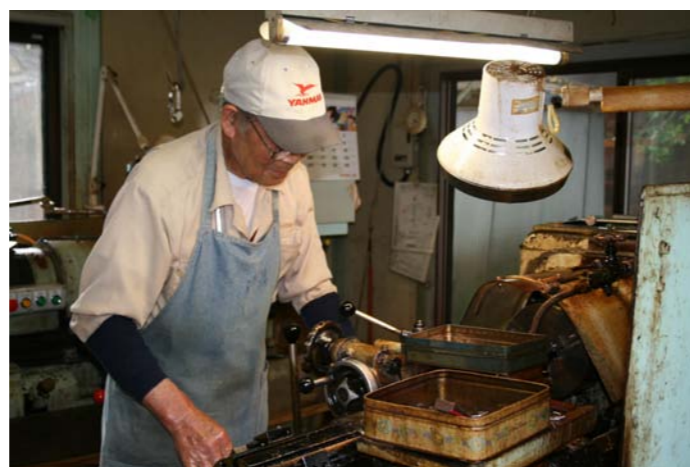
ヤンマーの家庭工場。昭和 30 年代から菅浦の集落内に作業棟が建てられ、現在でも約 10 ヶ所が操業しています。熟練した人達がエンジンの部品などを製造しています。