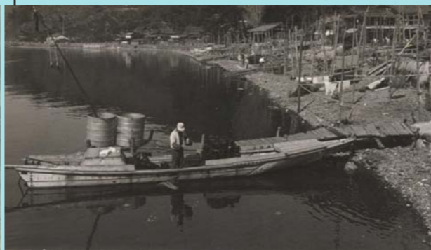
棧橋。浜には舟を係留させる棧橋がいくつかありました。写真の舟はエビタツペを載せています。