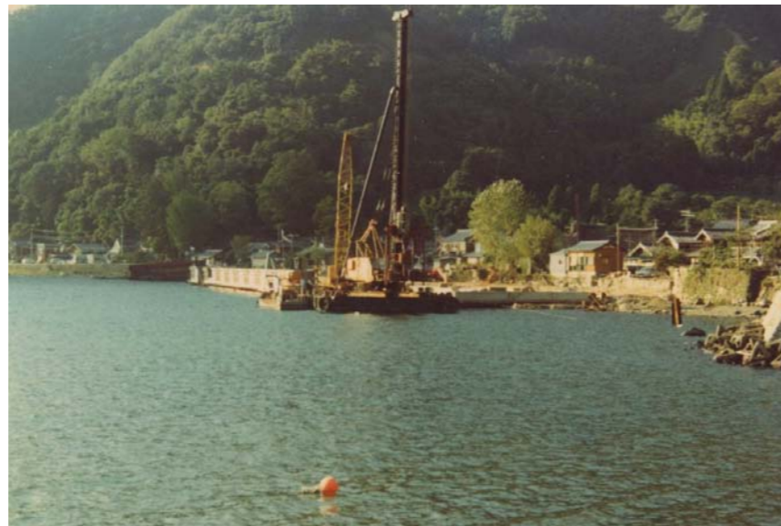
工事中の漁港。昭和 54 年 2 月に漁港が完成しました。それまで舟溜まりとして利用されていた西の川、東の川は埋立てられることに。浜の景観が大きく変わった時期です。

*ここでは地元の呼び方にない「漁港」としていますが、長浜市漁港等管理条約では「菅浦舟だまり」となっています。