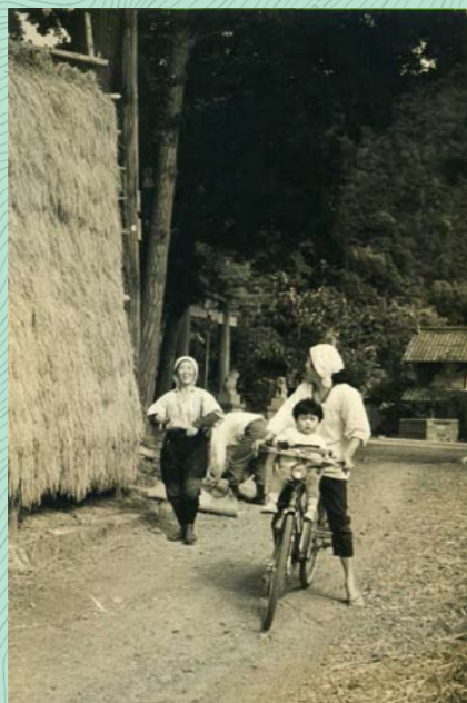
収穫の秋。ハサに掛けられた稲の前ではほほえむ女性たち。「豊作や!」という声が聞こえてきそうです。

菅浦では、漁業や稲作はもちろんのこと、世の中の情勢に合わせて林業や果樹栽培、タバコ、養蚕、鴨の養殖、さらには鉱山開発もおこなっていました。なぜこのように多種多様な生業を営んでいたのでしょうか。それは山と湖に囲まれ多くの恵みを得やすかったことなどが要因として考えられます。ここでは昭和三〇、四〇年代を中心に菅浦の生業の一端を紹介いたします。