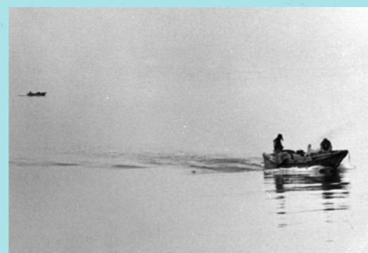
漁。陸に近く浅い所をウラ、遠い所をオキと呼びます。深さなどに合わせてエリ漁や、オイサデ漁、コイト網など様々な漁をおこないます。