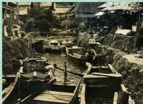
西の川。今は埋立てられています。昭和50年代前半まで集落の東西に舟溜りがありました。