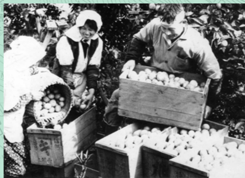
ミカン。寒い湖北でミカンとは意外に思うでしょうが、菅浦は南向きにひらけ気候が温暖です。古くからミカンやビワなどの果樹を栽培してきました。