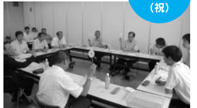
▲説明を聞いた後、評価を出す仕分け委員(昨年の様子)