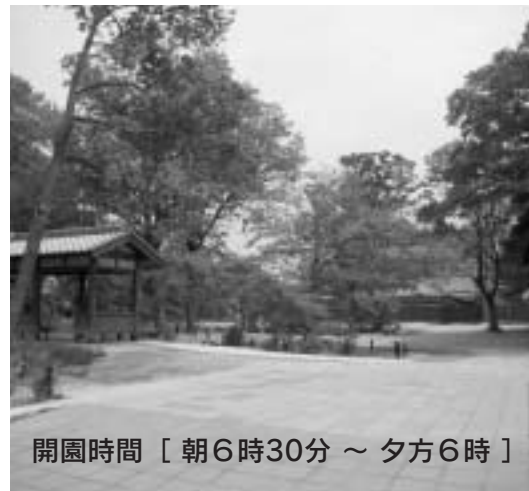
開園時間 [ 朝6時30分 ~ 夕方6時 ]

お問合せ・お申込みは、都市計画課都市デザイングループ(☎6562、FAX6540)へ。