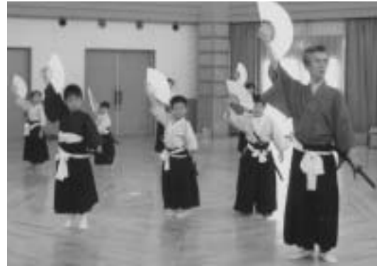
▲昨年の剣舞歌謡舞こども教室の様子

文化庁委嘱 (財)伝統文化活性化国民協定事業 「平成20年度伝統文化こども教室」 市内78箇所の教室が開催されます