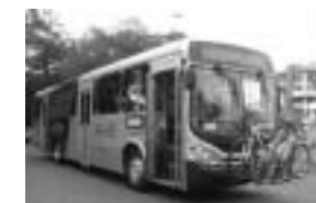
自転車を載せることが できる市バス