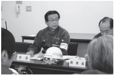
▲市災害対策本部本部員会議の様子

私は直ちに災害対策本部を設置し、本部員を招集するとともに、本部長となり原子力災害対策本部員会議を開催し、現地や関西電力(株)からの情報の収集・整理などの対応を指示しました。