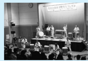
▲昨年のフェスタの様子

【内容】 ○ステージイベント ・ブラジル、タンザニアの文化紹介 ・国際カラオケ大会(長浜出身歌手「レオ」がゲスト出演)参加申込みは左頁参照 ・文化紹介(民俗衣装体験と記念写真、折り紙、書道、手品ショー、演奏会など) ・屋台料理ブース(インド、ネパール、ブラジル、韓国、中国、台湾、日本など) ・外国人生活応援バザー ・展示・啓発コーナー(写真コンテスト、姉妹都市等紹介、起震車・煙体験など)