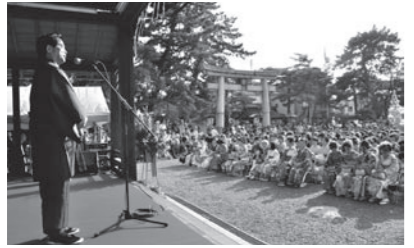
▲着物姿で出席した「きもの大園遊会」

着物は姿勢を正し、慎ましくやかで丈夫な美しい日本人の姿です。 世界に誇れる日本の文化です。私も久しぶりに着物姿になり園遊会を楽しみました。