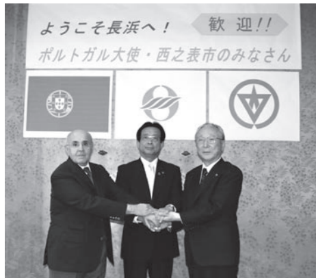
▲ポルトガル大使(左)、西之表市長(右)と きたい握手を交わす。

鉄砲は、今から470年前にポルトガルから日本・種子島へ伝わり、その翌年には、長浜・国友町で製造が始まったと伝わります。その「鉄砲」が縁で種子島の西之表市と長浜市が友好都市を提携し、市職員の人事交流をはじめ、市民間でのスポーツ交流や天体観望会などの歴史・文化交流など、さまざまな形で友好の輪が広がり、ゆるぎない友好の絆が築かれてきました。 特に種子島火縄銃保存会の皆さんと