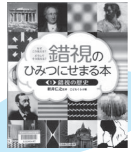
『錯視のひみつにせまる本』

ひっそりと時を重ね続ける各地の廃校を映した写真集。積み上げられた教科書、すりへったチョーク、予定が書かれたままの黒板…。まるで時が止まっているかのようにみえる教室も、植物の浸食によって時の流れを感じずにはいられない。そこに行ったことがなくても、どこか懐かしさを感じさせます。