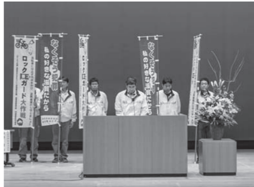
▲地域安全長浜市民大会 北郷里つくし会による大会宣言の様子