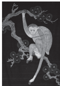
▲ 曳山 面幕(部分)

【とき】12月21日(月)～1月24日(日) 9時～17時(入館は16時30分まで) ※年末年始(12月29日～1月3日)は休館 【入館料】大人300円・小中学生150円 ※長浜市・米原市の小中学生は無料。 関 曳山博物館(☎65-3300)