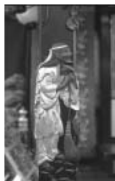
▲萬歳楼 高欄 姥

萬歳樓の舞台前柱の色絵象嵌飾り金具「高砂の尉と姥」は、年老いた男女の表情を白髪や顔のしわ、骨ばった手など実に細緻に表現してあり、名工・膳所の奥村晋次の作といわれています。長浜の曳山の飾り金具の半分以上は、彼の作品です。