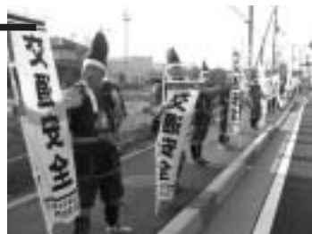
▲昨年の啓発の様相(国道8号線)

今回の重点項目は、①全ての座席のシートベルトとチャイルドシート の正しい着用の徹底、②自転車の安全利用の推進、③飲酒運転の根絶の3点です。