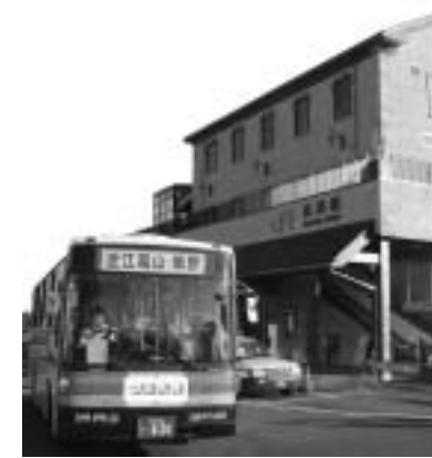
P11 公共交通調査事業を実施します

会場では、倒壊した建物からの救助訓練や負傷者の搬送、応急救護等が行われ、参加された約1,500人が真剣な表情で取り組まれました。