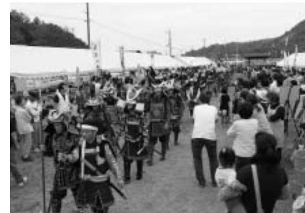
P12,13 ほっとにゆーす (小谷城ふるさと祭り)