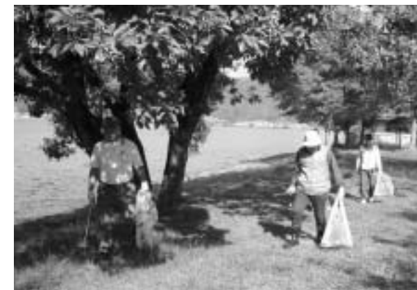
P14 環境美化活動団体登録制度11月1日スタート