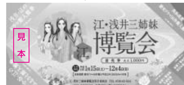
P21 江・浅井三姉妹博覧会情報