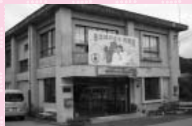
▲老朽化が著しい西黒田公民館

9月11日(土)、「西黒田ふるさと振興会議」の役員の皆さんと第三回「座ぶとん会議」を行いました。 参加いただいた皆さんからは、公民館の早期建て替えと今後の管理運営体制などについてお話をいただきました。また、「絆」が薄くなってきている時代の中で、地域の人のコミュニティを醸成するため、金太郎相撲大会を毎年開催したり、できるだけ住み慣れた西黒田に最後まで暮らしてほしいと介護予防を目的に転倒防止事業を月2回開催しているの報告もいただきました。そして、地域づくり協議会を設立して4年間、みんなが一生懸命活動してきたが、メンバーも高齢化してきたこの後どうやっていくか不安というお話もいただきました。 市長も、「絆」はとても大切なことです。健康で長生きし、地域で公民館を活用した様々な取り組みを進めていただくには、現在の高齢者の方々に感謝の気持ちを伝えることが大切だと思っています。引き続き、