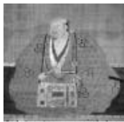
▲伝井口弾正肖像画

■ギャラリートーク 【とき】1月22日(土) 13時30分～ 【案内人】高月観音の里歴史民俗資料館学芸員