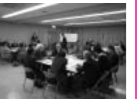
▲市民座談会の様子

市から路線バスの現状について、また滋賀大学から現在実施中の公共交通調査について報告し、各テーブルでは自分たちの身の回りの交通手段について意見交換をしていただきました。