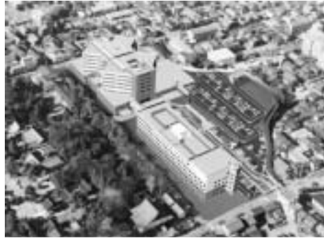
▲病院完成イメージ写真