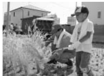
▲口分田の田んぼで、気持ちの良い汗を流しました

汗だくの稲刈りと運動会 いよいよ「実りの秋」「スポーツの秋」のシーズンです。湖北の田んぼは「黄金色」一色に染まりました。農家の皆さんは残暑が続く中、熱中症を心配しながらの汗だくの稲刈り作業だっただけでなく、心配して台風も比較的少なく、今年も比較的安心です。私は、9月の日曜日に市内の農家を訪問し、地元の小中学生や保護者の皆さん、それにJAの方々と一緒に稲刈りをしました。最初にスタッフの方から「カマコ」による稲刈りの方法や注意点を詳しく説明していただき、その後、一斉に元気の良い40人を超える子ども達と田んぼに入り作業を始めました。 稲刈りも「コンバイン」が常識の中、「カマ」は懐かしく感動で「カマ」でも達は、最初は慣れない「カマ」でしたが、段々と上達しサクサクと手際よく作業が進みました。そして、土や稲の香りが肌で感じ、秋の虫と接