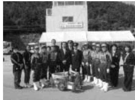
新庄中町女性防火クラブの皆さんと寄贈された軽可搬消防ポンプ

なお、新庄中町女性防火クラブは、10月19日(水)に横浜市中で開催された第20回全国女性消防操法大会に滋賀県代表として出場され、敢闘賞を受賞されました。