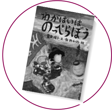
『わがはいはのつべらぼう』 文/富安 陽子 絵/飯野 和好 童心社

お出かけの時に着るものなんて気にしない、好みで決める、身近な人に任せきり、といった人のための手軽な一冊。 俺流が見事にまとまっていったら、ファッションセンスがいろいろいいことですね。 外見は、心や脳の鏡のようなもの、見た目も大切です。