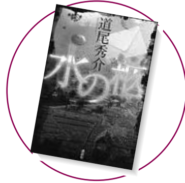
『水の枢』 著/道尾 秀介 講談社

自分が「普通」であることに、焦燥を抱える中学生の逸男。彼は、両親の離婚や級友からのいじめを受け、「普通」であることを望む同級生の敦子と文化祭を機に話すようになった。そして敦子に、小学校に埋めたタイムカプセルと一緒に掘り出して欲しいと頼まれる。やがて、敦子の秘めた強い決意と、祖母の過去を知った逸男は・・・