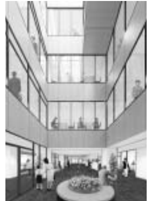
市民ギャラリーイメージ図