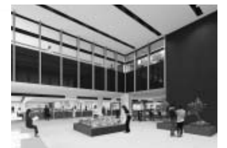
市民交流ロビー・市民情報コーナーイメージ図