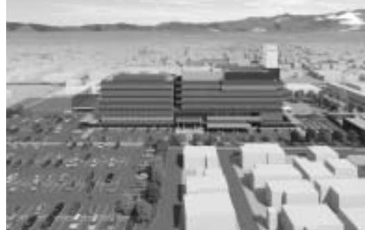
敷地南側上空から望む外観イメージ