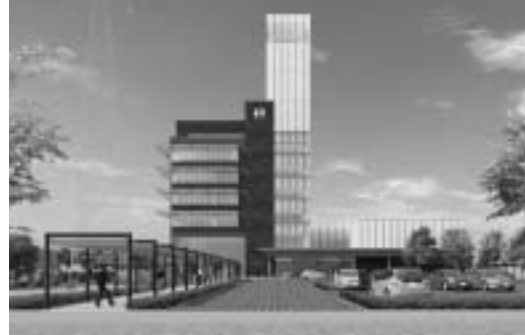
東側正面アプローチからの外観イメージ