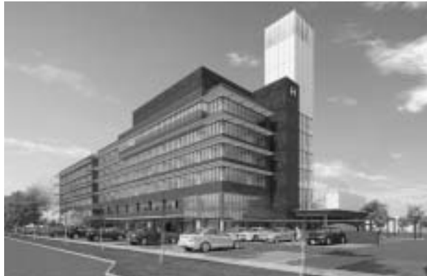
敷地南東より望む外観イメージ