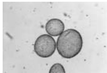
赤潮の原因である ウログレナ・アメリカナ

問 滋賀県 琵琶湖環境部 環境政策課 (☎077-528-3357) Eメールde00@pref.shiga.lg.jp