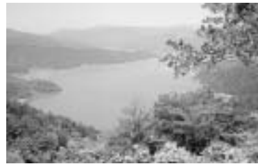
賤ヶ岳山頂から 余呉湖を眺める