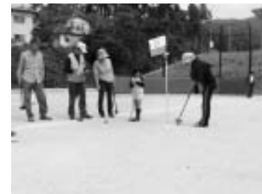
▲グラウンドゴルフ大会