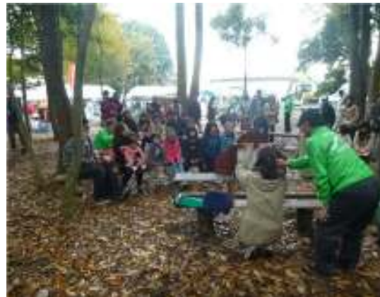
長浜市森づくりふれあいフェスタ

そこで審議会では、広く市民や企業等に森林に関する多様な情報の発信と魅力を浸透させるための方向性について、次のように提言します。