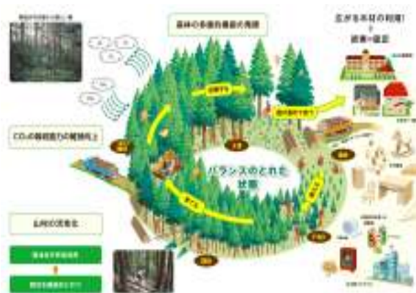
健全な森林のサイクル図

審議会としては、森林が持つこれらの機能や働きについて、一層森林の大切さを啓発するため、長浜市の地球温暖化対策に関する各種計画との整合性を図りながら、森づくり計画へ反映されるよう提言します。