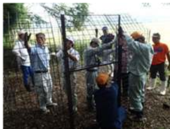
地元による防護柵の設置