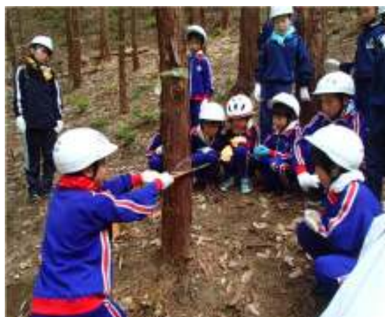
やまのこ活動の様子

長浜市では、森林環境学習として市内の小学校4年生を対象にした「やまのこ」事業を実施されており、日常生活の中で森林にふれる機会が少なくなった子どもたちが、実際に森林の中で、森林の持つ役割や大切さなどについて学習することは、大変意義のあることであり、今後も継続して取り組まれることが望まれます。