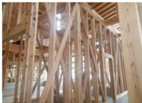
森林資源の利活用（木造住宅）

審議会としては、市産材はコストが高いといったイメージが先行していることや木材の生産、流通、加工の各段階が小規模・分散・多段階となっていることか