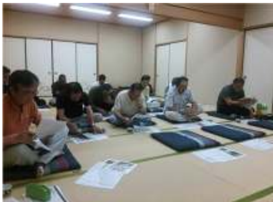
施業集約化の地元説明会