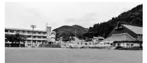
▲旧上草野小学校の施設