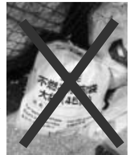
Un ejemplo de la forma de depositar basura que impide la verificación del contenido

Información: Kankyō Hozenka Tel.: 65-6513