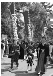
▲ Naginatagumi no Tachiwatari