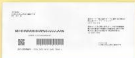
①Envelope para o destinatário