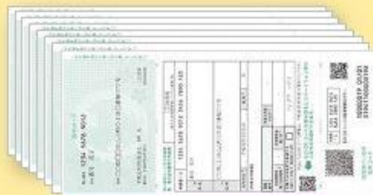
②Cartão de Notificação do Sistema My Number + Formulário de solicitação do cartão My Number + Adesivo com Onsei Code (código de voz). ※De toda a família (no máximo 8 cartões por envelope)