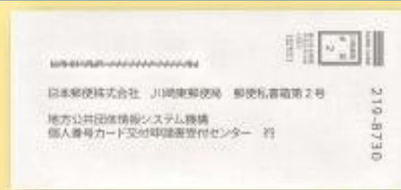
④Envelope resposta para solicitar o cartão My Number