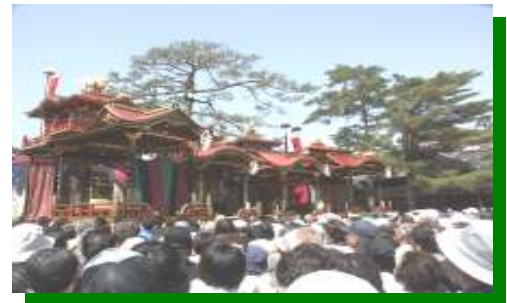
Os carros no Templo Nagahama Hachimangu

Este é um dos três maiores festivais “hikiyama” do Japão, atraindo turistas de todo o país, seja para assistir o teatro Kabuki ou mesmo para ver de perto a beleza de cada carro. Não deixe de conferir!