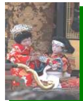
Os carros se transformam em palcos para o Teatro Kabuki