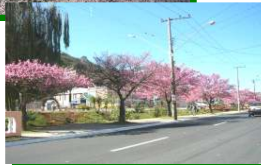
Ápice da Florada das Cerejeiras em Nagahama e em Piedade/SP

Caso tenha alguma dúvida, crítica ou sugestão, entre em contato conosco através do e-mail: