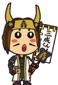
Mascote oficial: Mitsunari-kun