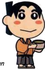
Mascote oficial: Sakichi-kun

Vamos conhecer melhor a história de nossa cidade!!