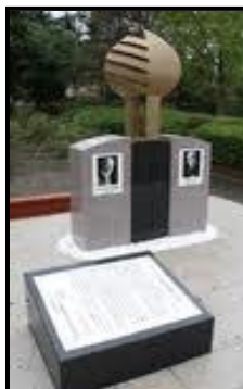
Monumento em homenagem aos 50 anos do tratado de amizade localizado no Houkouen

Nesta edição falaremos sobre o tratado de irmandade de Nagahama e Augsburg.