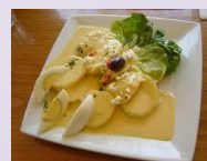
Papa a la huancaína