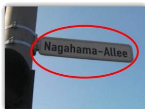
Nome de uma rua na cidade e Augsburg, Alemanha.

Todos os anos, alternadamente, um grupo de jovens japoneses de Nagahama vai a Augsburg e um grupo de lá vem à nossa cidade. Esse intercâmbio cultural tem como objetivo fortalecer os laços de amizade e cooperação entre essas duas nações.