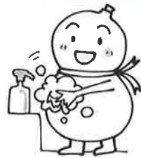
長浜市健康づくり推進キャラクター キレイちゃん

会員の皆さんお元気です。ご報告致します。また、制約も有り活動開始は秋以降となりましたが、各地区において感染対策をとりつつ従来の繋がりを大切に種々の活動に取り組んでいます。今迄の健康推進員活動が生かされま