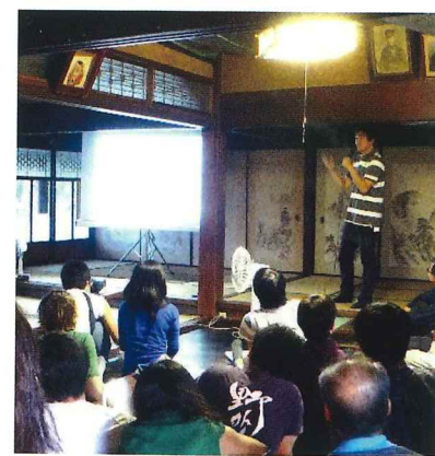
2013年、世界的研究者に空き家で講演会

この方は、以前M-I-Tの研究所メディアラボに所属されていたご縁で田根に来訪され、講演をしていただいています。今後もこうした交流を大切にしていきたいと思っています。