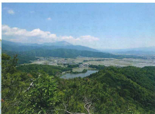
小谷山から見た田根地区

5月22日に行われた一日回峰行に参加してきました。 多くの参加者の方と一緒に歩き、自然や歴史を感じられました。野生の草花、動物の痕跡、小谷城の石垣など、見どころいっぱい楽しかったです。 こんな素敵な景色を多くの皆さんと共有できたことに感謝です。秋にもあるらしいので、紅葉を楽しむにそちらも参加したいと思っています。