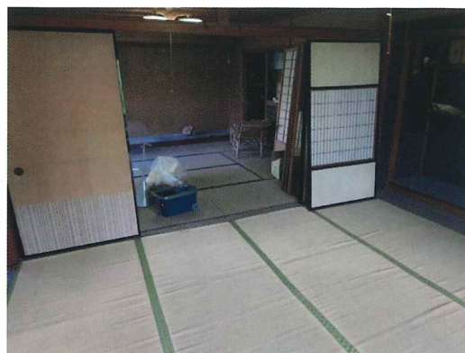
離れ？書院？の掃除中！

高知町にお借りしている自宅の片付け、掃除を始めました。とても広い邸宅で、私が住むだけだと持て余すのできれいに掃除・リノベーションして、何かに使えないか検討しています。 皆さんが集まれるコミュニティスペースやカフェ、飲食店、オフィスなど、想像しただけでワクワクします。皆様からもアイデア募集します！こんな施設があればいいなあ等ぜひ教えてください！