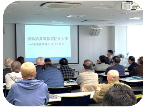
特殊詐欺等被害防止対策研修会

2月21日 えきまちテラス長浜イベント広場で滋賀県警察と長浜署がパトロールコンサートを実施しました。警察音楽隊の演奏にのせ、寸劇やオリジナルソングで特殊詐欺の手口や対策を紹介し、被害にあわないよう注意喚起を行いました。