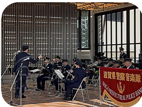
警察音楽隊 パトロールコンサート

2月21日 えきまちテラス長浜イベント広場で滋賀県警察と長浜署がパトロールコンサートを実施しました。警察音楽隊の演奏にのせ、寸劇やオリジナルソングで特殊詐欺の手口や対策を紹介し、被害にあわないよう注意喚起を行いました。