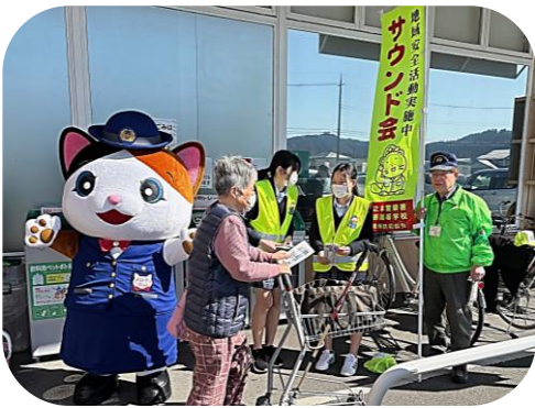
伊香高校防犯ボランティア SOUND会 (サウンド)