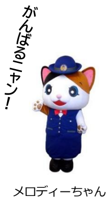
メロディーちゃん

6月8日、伊香高校のボランティアサークル「SOUND会」の指定書交付式が開催されました。「共に響き合い、健全な青少年を育成すること」を目的に結成され、今年で20年目を迎えます。特殊詐欺やトクリウ犯罪の被害防止を呼びかける「トクまも県民運動」の啓発活動、通学路の見守りなど、地域の安全を守る活動に取り組むこととしています。