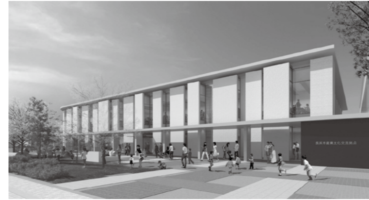
▲駅前通からみた外観イメージ

市立長浜病院事務局総務課 〒526-8580 大戌亥町313 ☎68-2324(直通)